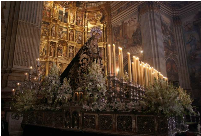
Ntra. Sra. de la Soledad el día 22 de octubre, día de su Salida

Era la noche de Navidad. Un ángel se apareció a una familia rica y le dijo a la dueña de la casa: "te traigo una buena noticia; esta noche el Señor Jesús vendrá a visitar tu casa".